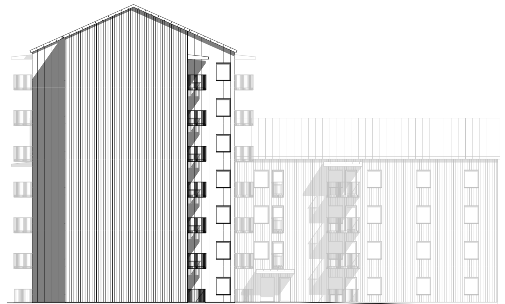
FASAD MOT VÄSTER 1:200