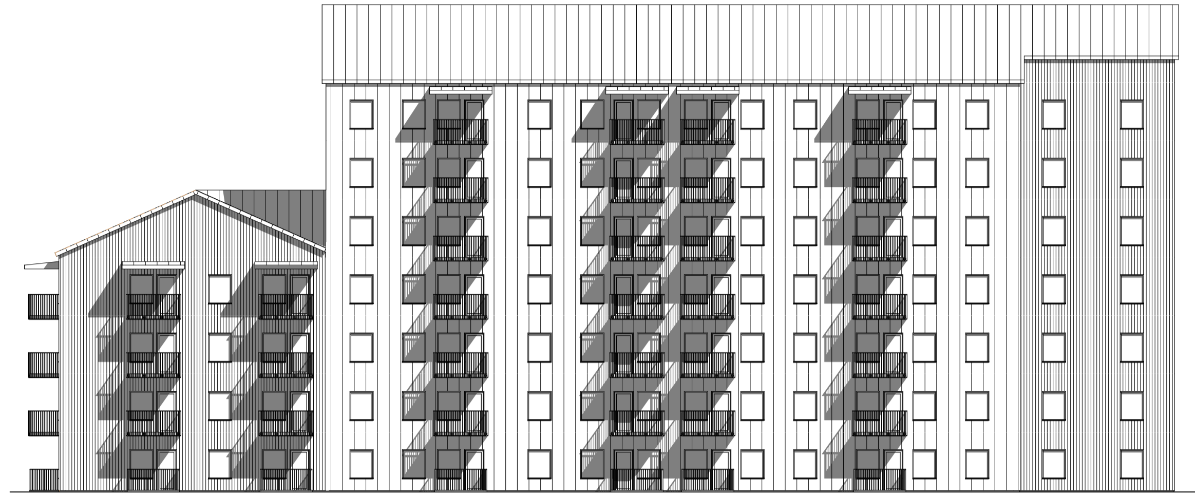
FASAD MOT NORR 1:200