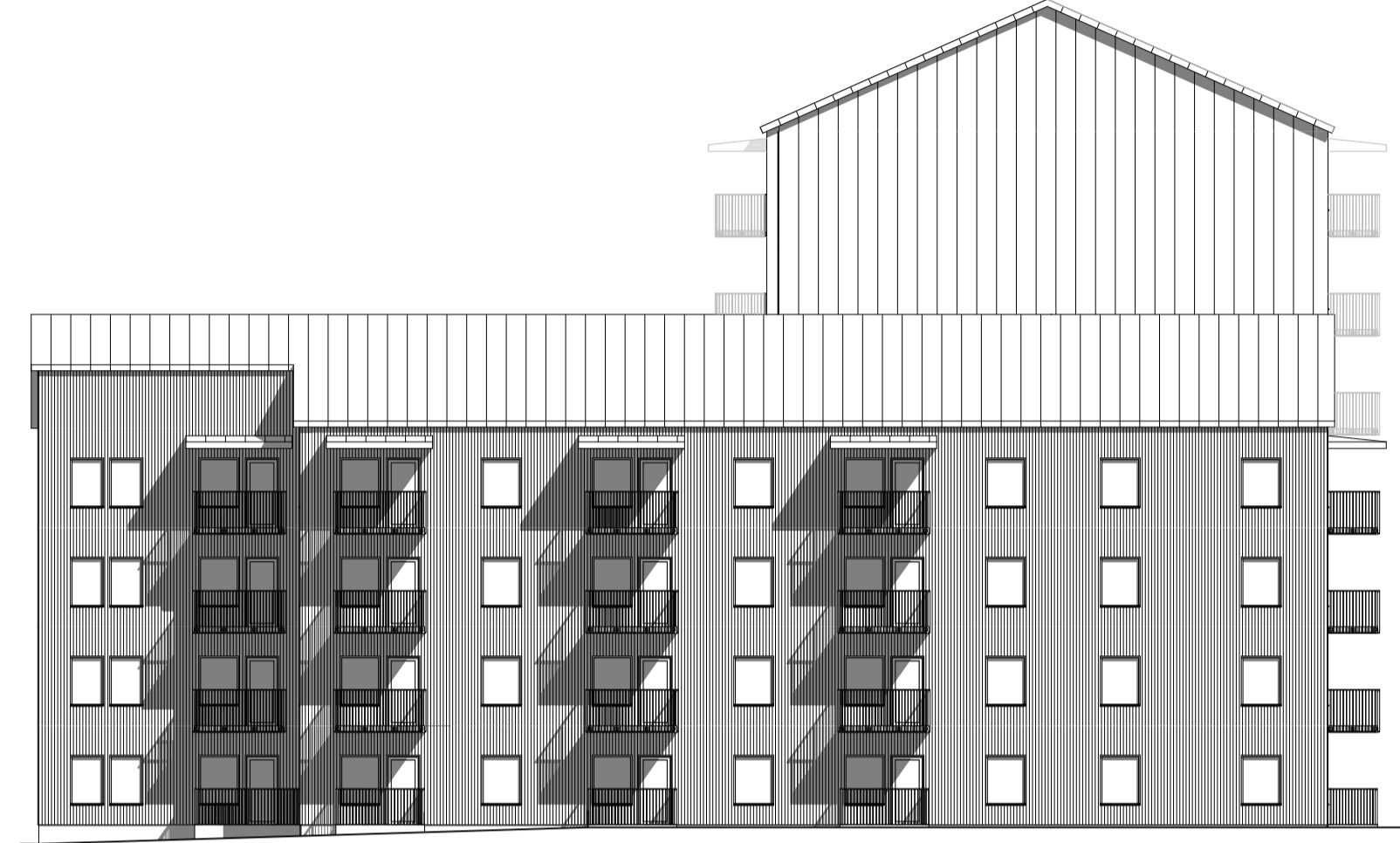
FASAD MOT ÖSTER 1:200