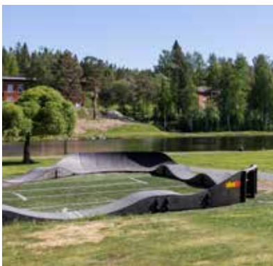
Pumptrack-banan vid sjön Sidtjärn som Skebo låtit bygga är flitigt använd.