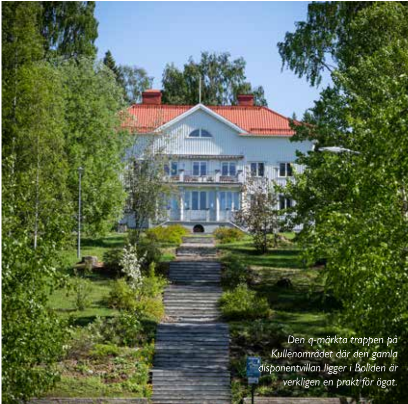
Den q-märkta trappen på Kullenområdet där den gamla disponentvillan ligger i Boliden är verkligen en prakt för ögat.