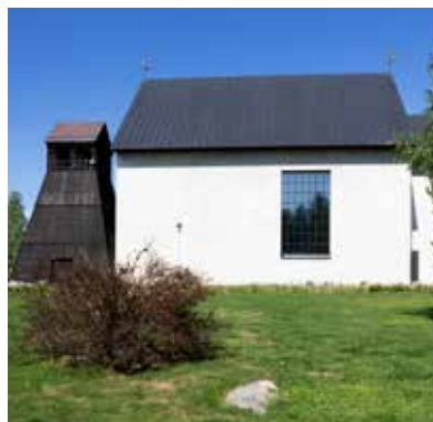
Bolidens kyrka invigdes 1960 och ritades av arkitekten Peter Celsing, kallad för sin tids stora konstnärsarkitekt.

starka engagemang där avtog stagnerade det och en slags kräftgång inleddes. Under lång tid tilläts stora delar av samhället förfalla och fram till 2000-talets början närmast halverades befolkningen på orten.